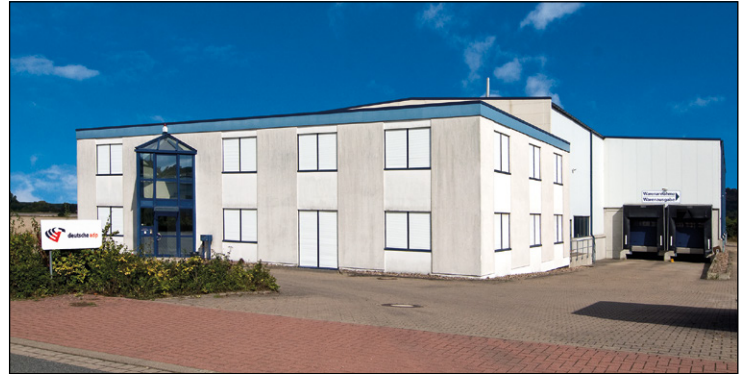
Der neue Niederlassungssitz befindet sich in Gehrden.

Am 10. und 11. März lädt die Niederlassung Hannover der deutschen adp zum Open House ein.