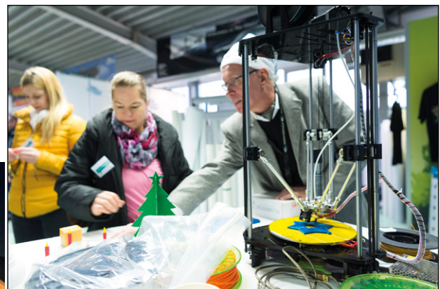
Vor Kurzem ist das Studio für Digitaltechnik Knaup in den 3D-Druck eingestiegen.